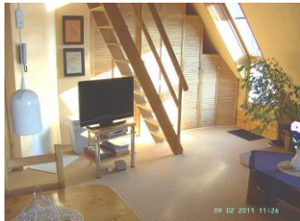
Treppe zur Schlafebene